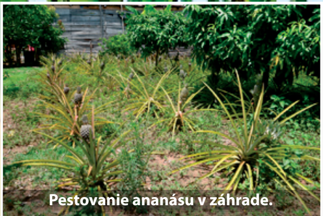
Pestovanie ananásu v záhrade.