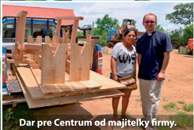
Dar pre Centrum od majiteľky firmy.