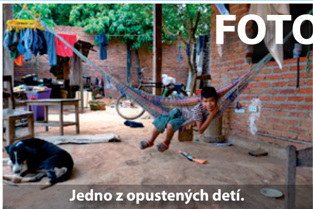
Jedno z opustených detí.