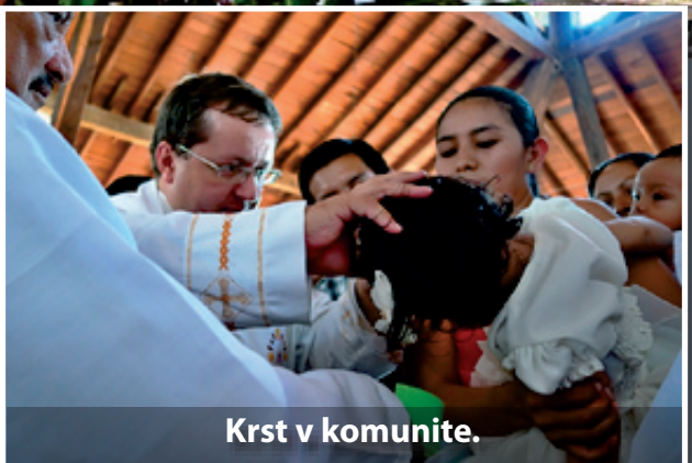
Krst v komunite.