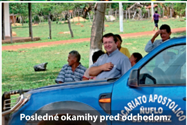
Posledné okamihy pred odchodom.