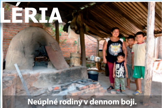
Neúplné rodiny v dennom boji.