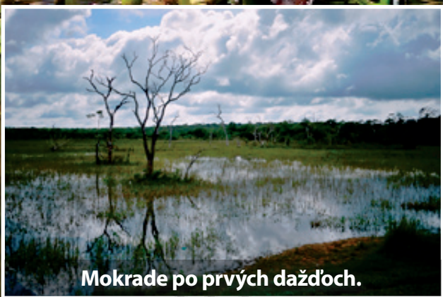
Mokrade po prvých dažďoch.