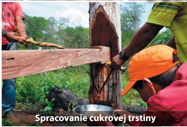
Spracovanie cukrovej trstiny