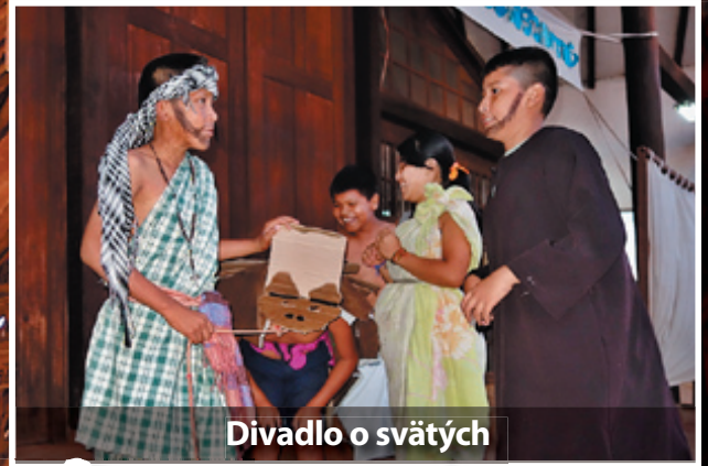
Divadlo o svätých