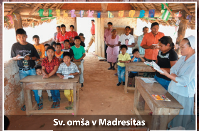
Sv. omša v Madresitas

Milí priatelia! Ak by ste vnímali, že chcete podporiť misijnú činnosť, pastoraáciu alebo chudobných vo farnosti Concepción, môžete tak urobiť prostredníctvom bankového účtu: IBAN SK080900000000522512863.