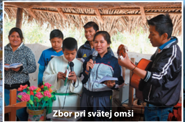
Zbor pri svätej omši