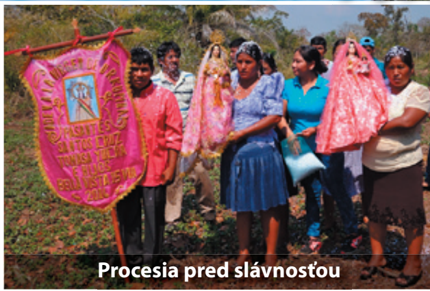
Procesia pred slávnosťou