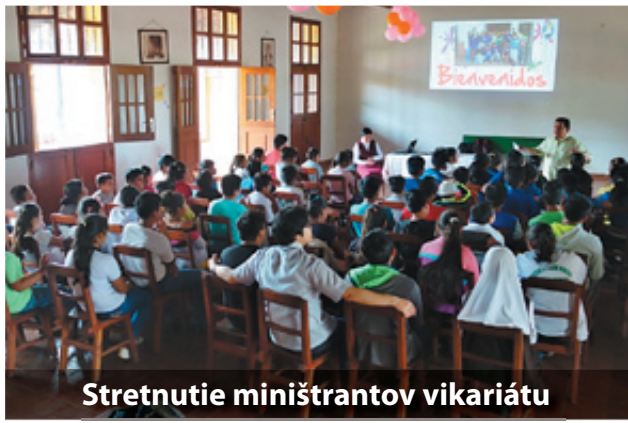
Stretnutie miništrantov vikariátu