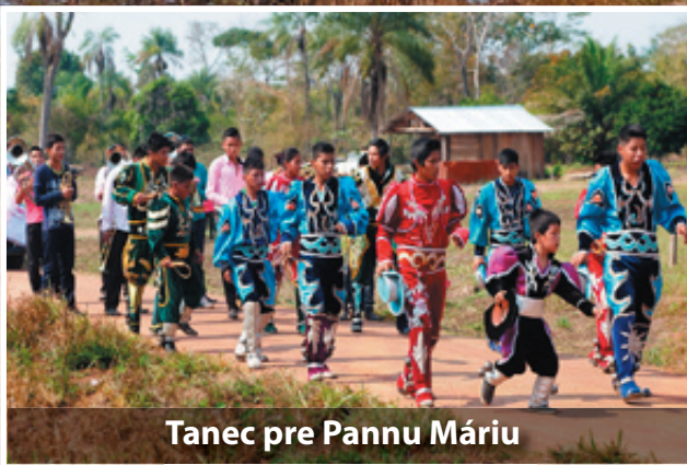
Tanec pre Pannu Máriu