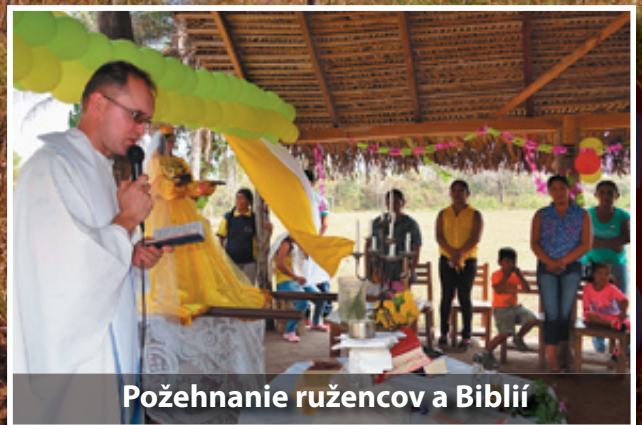
Požehnanie ružencov a Biblií