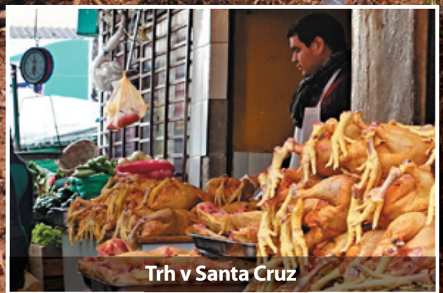
Trh v Santa Cruz