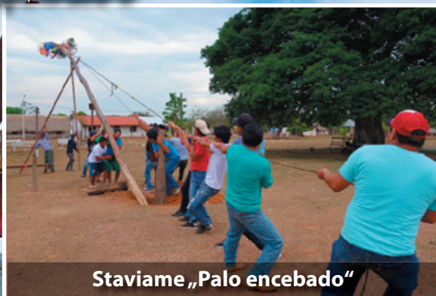
Staviame „Palo encebado“