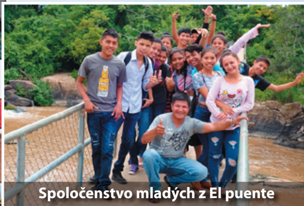
Spoločenstvo mladých z El puente