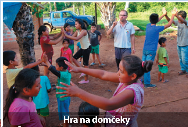
Hra na domčeky